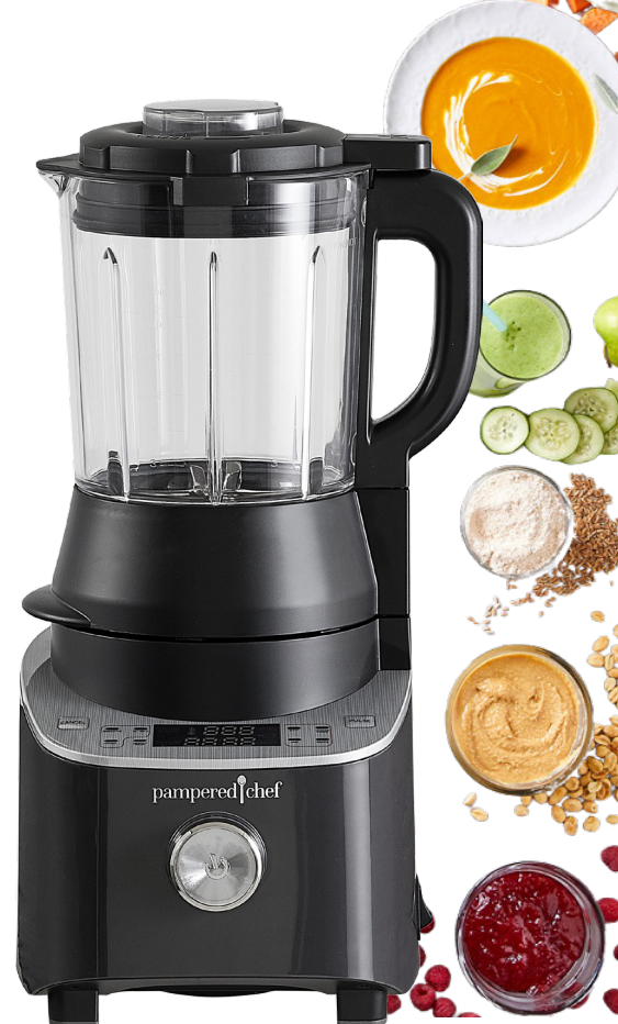
Deluxe Blender | #100222 349€ 315 €*